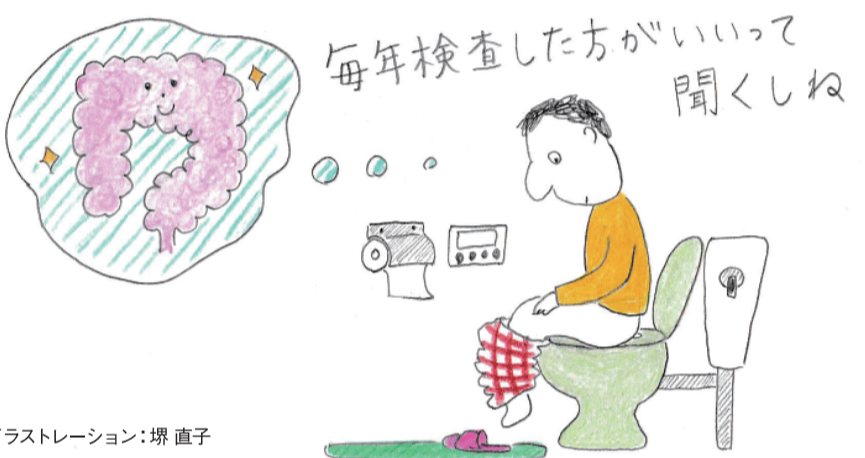
イラストレーション: 塚 直子

なお、大腸がん検診や大腸がんについてわからないことがあるときは、薬局の薬剤師に気軽にご相談ください。